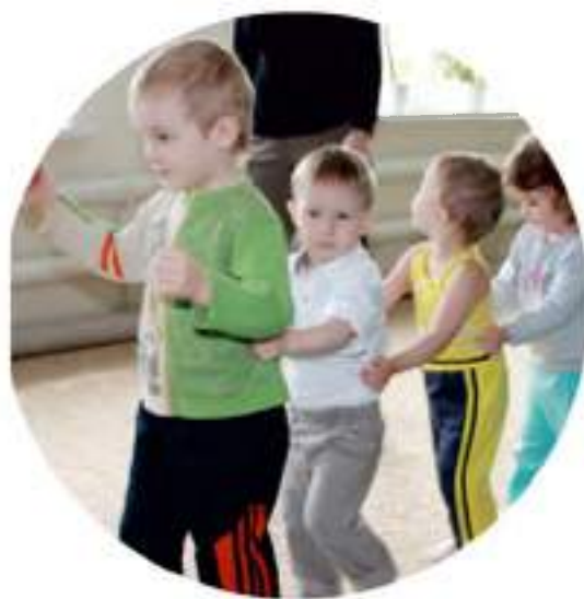
Областной центр реабилитации инвалидов

В этот день была создана особенно душевная атмосфера общения отдыхающих друг с другом, с коллективом центра – возможность почтить память погибших, поздравить друг друга с праздником Великой Победы.